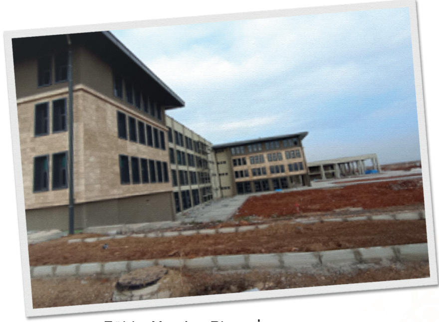
Eğitim Yapıları Binası İnşaatı

Proje toplam tutarı 73.630.820,00 TL olarak belirlenmiş olup yıllara sâri iş olduğundan fiyat farkları ile birlikte sürekli güncellenmektedir. 2022 yılı 4.dönem sonu itibari ile fiziki gerçekleşme oranı %80, nakdi gerçekleşme oranı %68,46'dır.