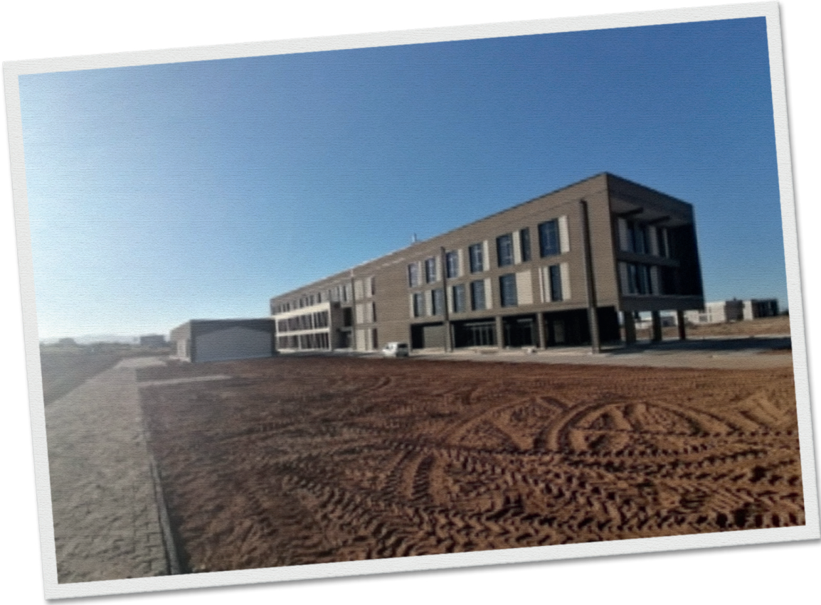
Yeşilyurt Meslek Yüksekokulu Binasi İnşaatı