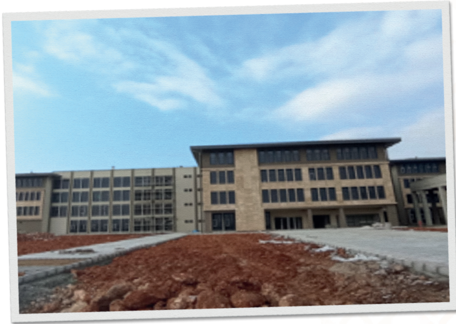
Eğitim Yapıları Binası İnşaatı