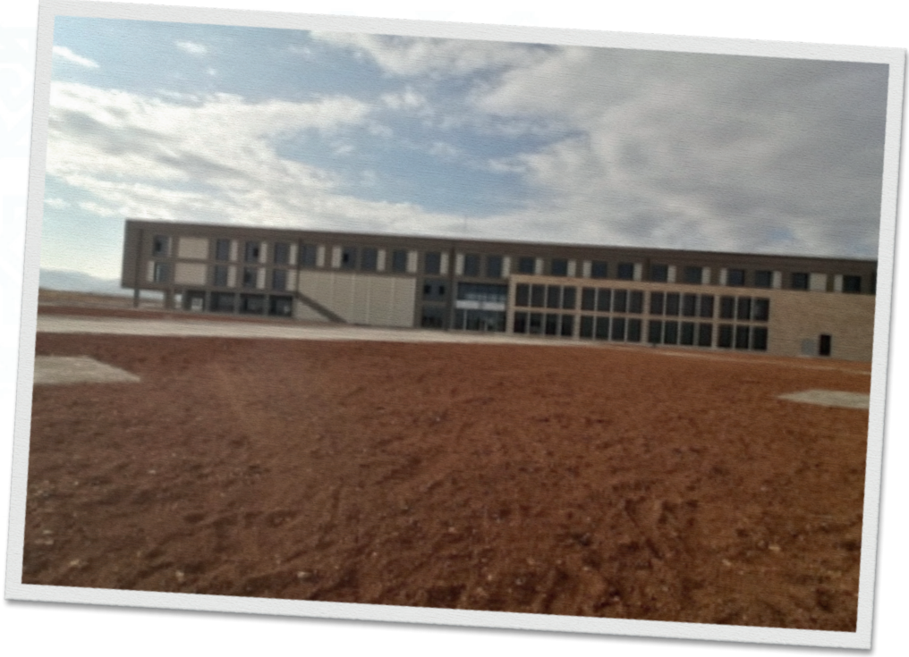
Yeşilyurt Meslek Yüksekokulu Binasi İnşaatı